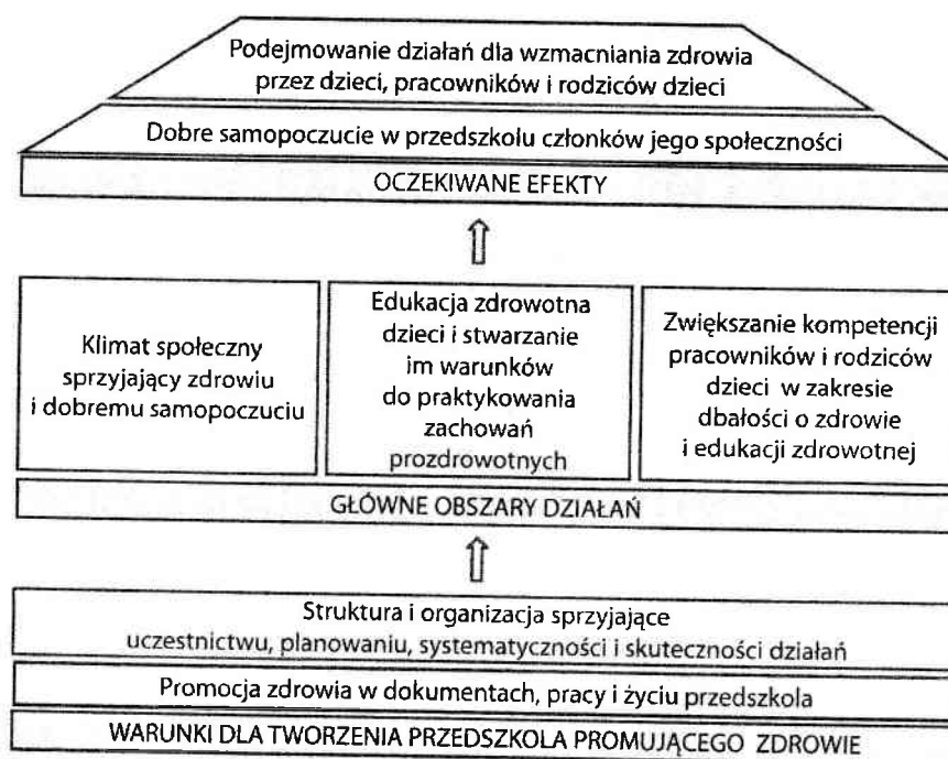
Ryc. 1. Model przedszkola promującego zdrowie

W modelu PPZ uwzględniono trzy poziomy: warunki dla tworzenia PPZ, główne obszary jego działań i oczekiwane efekty (ryc. 1).